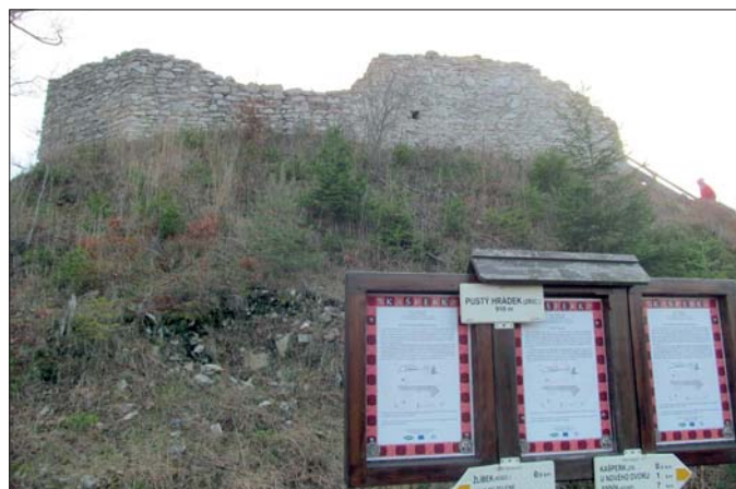
Rozcestí u Pustého hrádku