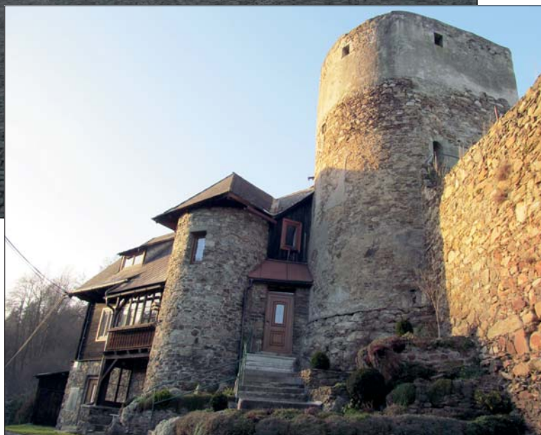
Část hradeb vimperského zámku s obydlím

První písemná zmínka o sídle pochází z roku 1337. Původně hornická osada na těžbu zlata byla za vlády Jana Lucemburského povýšena na horní město – událost připomíná pamětní deska. Karel IV. dal k ochraně Zlaté stezky do Pasova vystavět roku 1356 hrad Kašperk, který je dodneška nejvýše postaveným královským hradem v Čechách. Hrad pak několikrát změnil majitele a roku 1616 jej koupilo město Reichenstein, odtud tedy název Kašperské Hory. Již tehdy hrad chátral a začal se opravovat až počátkem 20. století.