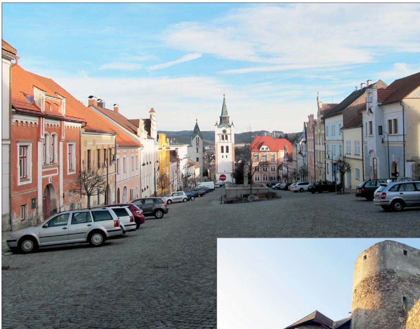
Náměstí ve Vimperku

První písemná zmínka o sídle pochází z roku 1337. Původně hornická osada na těžbu zlata byla za vlády Jana Lucemburského povýšena na horní město – událost připomíná pamětní deska. Karel IV. dal k ochraně Zlaté stezky do Pasova vystavět roku 1356 hrad Kašperk, který je dodneška nejvýše postaveným královským hradem v Čechách. Hrad pak několikrát změnil majitele a roku 1616 jej koupilo město Reichenstein, odtud tedy název Kašperské Hory. Již tehdy hrad chátral a začal se opravovat až počátkem 20. století.