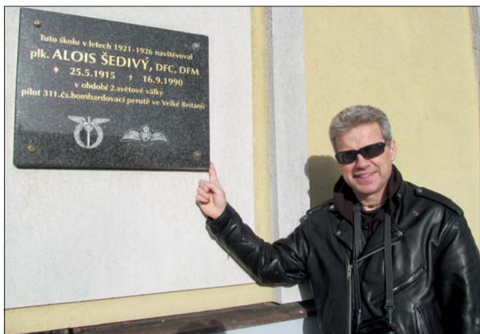
Pamětní deska rodáka – pilota RAF