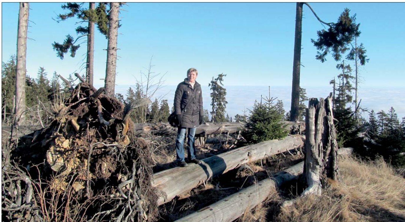
V Boubínském pralese

Je označován za nejvýznamnějšího českého architekta 19. století a rovněž patří k nejznámějším architektům v zemi. Zásahu na tom má především jeho podíl na návrhu a stavbě pražského Národního divadla. Profesor Zítek nevytvořil pouze tuto budovu, podílel se také na návrhu pražského Rudolfinu a jeho stavby byly zrealizovány i v ostatních částech Čech. Věnoval se restaurování budov, upravoval Mlýnskou kolonádu v Karlových Varech nebo Ru-