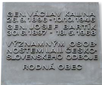
Stachy na své hrdiny z II. odboje nezapomínají

Utrpěl zranění a po jeho vyléčení nastoupil v roce 1919 jako referent do zpravodajského oddělení Hlavního štábu čs. armády. Den před vpádem nacistů do Čech odešel s Františkem Moravcem do exilu. Nejdříve pracoval ve Velké Británii, pak byl odeslán do Polska a po jeho obsazení odešel do Francie, kde řídil obrannou skupinu při čs. vojenské správě. Po pádu Francie byl jmenován do funkce přednosty obranného zpravodajství II. odboru exilového MNO. Názorově se později s Františkem Moravcem rozešel. Od 1. března 1945 působil v Košicích a v srpnu byl jako přednosta odboru pro politické zpravodajství ministerstva vnitra povýšen do hodnosti brigádního generála.