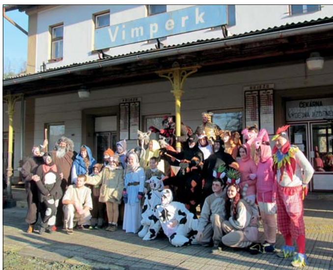
Čekání na Noemovu archu – silvestrovské veselí 2015

Od 13 let byl vychováván u strýce, protože rodiče se vystěhovali do USA. V roce 1916 byl jako čerstvý absolvent gymnázia odvelen na italské bojiště 1. světové války. O rok později padl do zajetí. Později vstoupil do řad československých dobrovolných jednotek v Itálii a zúčastnil se aktivně bojů.