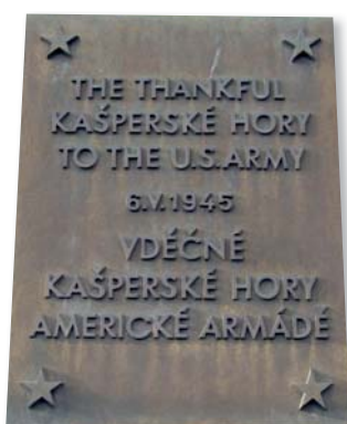
Události, které připomínají tyto pamětní desky, od sebe dělí 600 let – první přinesla městu prosperitu – druhá alespoň na krátký čas pocit svobody...