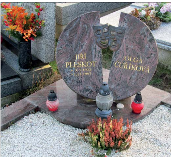
Malenice n.V. – hrob Jiřího Pleskota

Po komunisty připravené provokaci byl 15. ledna 1946 odvolán z funkce, a přestože se později potvrdilo, že celá akce byla blamáž, do funkce se již nevrátil. Dne 9. března 1948 byl zatčen a později odsouzen na 5 let těžkého žaláře za údajné vyžrazení služebního tajemství. Poznal vězení