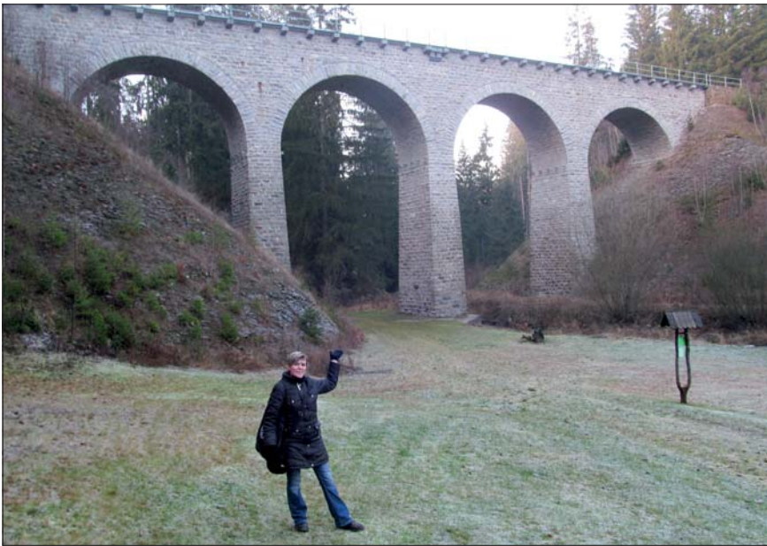
Viadukt nedaleko Vimperka z roku 1900

Utrpěl zranění a po jeho vyléčení nastoupil v roce 1919 jako referent do zpravodajského oddělení Hlavního štábu čs. armády. Den před vpádem nacistů do Čech odešel s Františkem Moravcem do exilu. Nejdříve pracoval ve Velké Británii, pak byl odeslán do Polska a po jeho obsazení odešel do Francie, kde řídil obrannou skupinu při čs. vojenské správě. Po pádu Francie byl jmenován do funkce přednosty obranného zpravodajství II. odboru exilového MNO. Názorově se později s Františkem Moravcem rozešel. Od 1. března 1945 působil v Košicích a v srpnu byl jako přednosta odboru pro politické zpravodajství ministerstva vnitra povýšen do hodnosti brigádního generála.